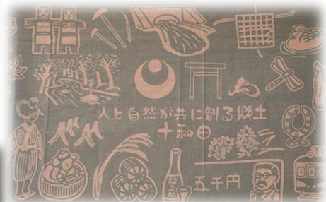
「十和田ご当地てぬぐい」